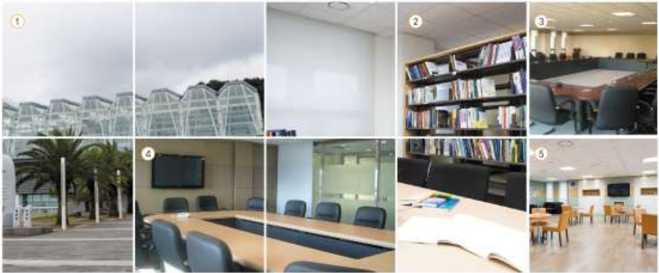
①전경 ②자료실 ③회의실 ④세미나실 ⑤휴게실