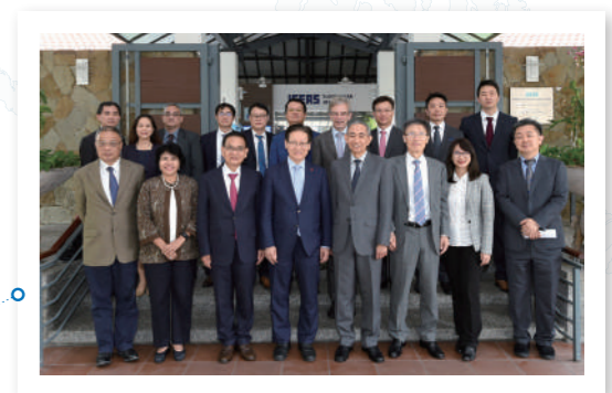
싱가포르 ISAES-Yusof Ishak Institute